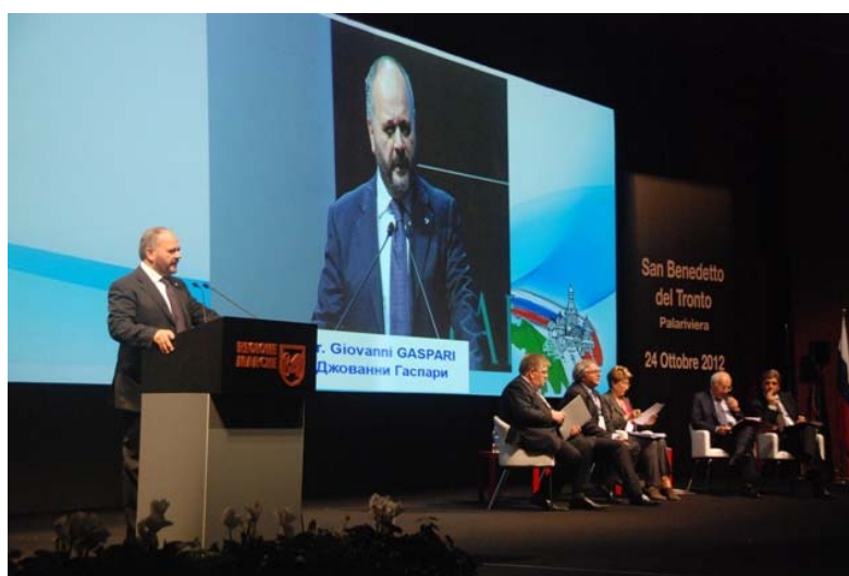
Мэр города Сан Бенедетто дель Тронто Дж. Гаспарри

Выбор области Марке в качестве принимающей стороны был обусловлен традиционно интенсивными торгово-экономическими связями