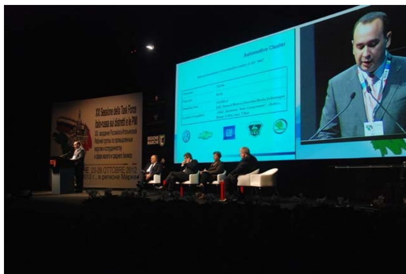
Министр поддержки и развития малого предпринимательства, потребительского рынка и услуг Нижегородской области Д.И.Лабуза

С презентацией Нижегородской области выступил Министр поддержки и развития малого предпринимательства, потребительского рынка и услуг Нижегородской области Д.И.Лабуза, который предложил провести следующее XXI заседание рабочей группы в г.Нижнем Новгороде в мае 2013 года. Готовность принять данное мероприятие в видеообращении к участникам рабочей группы выразил Губернатор Нижегородской области В.П. Шанцев.