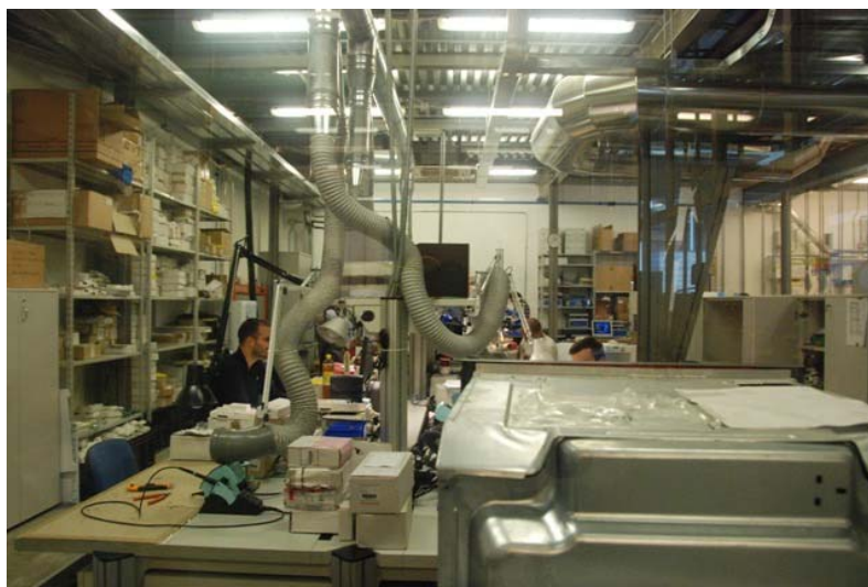
Посещение исследовательского центра компании «Индезит»