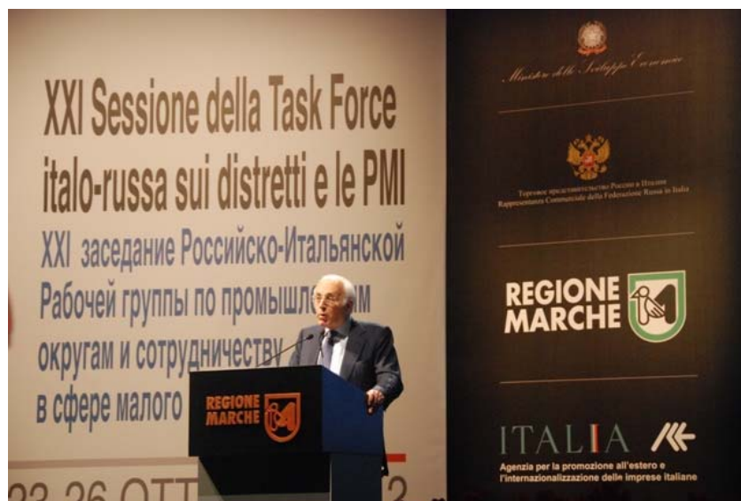
Заместитель министра экономического развития Италии М.Вари

региона с Россией, ростом двустороннего товарооборота, наличием современной производственной базы в области машиностроения, альтернативной энергетики и энергосбережении, логистики.