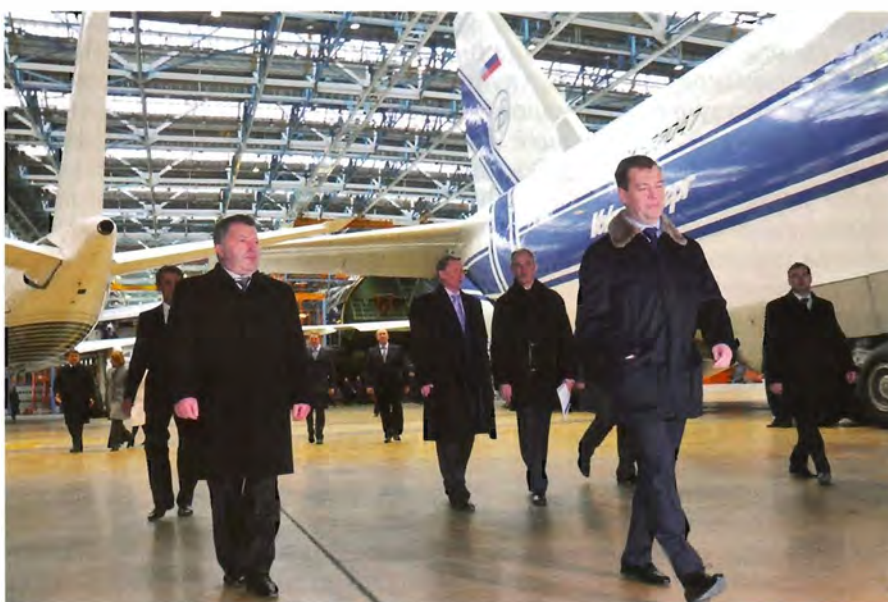
Dmitrij Medvedev visita lo stabilimento aeronautico "Aviastar-SP"

Дмитрий Медведев во время посещения завода "Авиастар-СП"