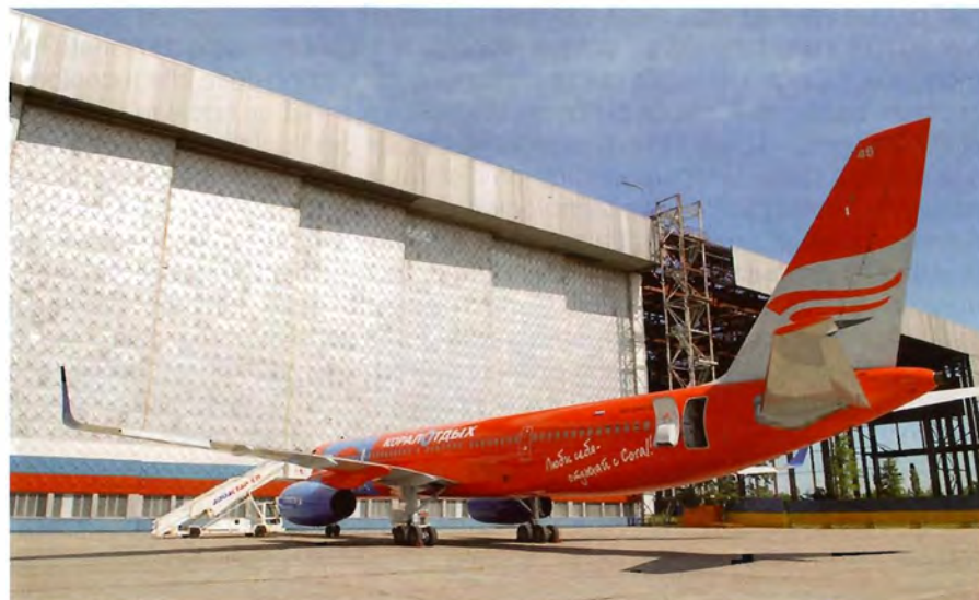
Lo stabilimento ZAO "Aviastar-SP"