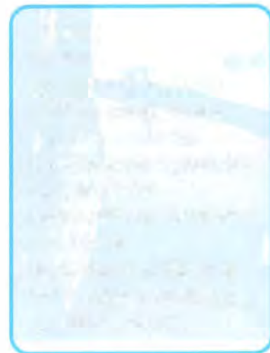
Il centro di Ulyanovsk

L'efficacia di questi provvedimenti è stata confermata anche dalle organizzazioni economiche e imprenditoriali. Il 13 dicembre 2010 nel quadro del convegno sulla "Strategia di sviluppo economico-sociale della regione di Ulyanovsk fino al 2020. Il programma per il periodo 2010-2013" il Governo regionale e l'associazione russa "Delovaya Rossiya", espressione della società civile, hanno firmato un accordo di cooperazione. Esso prevede l'elaborazione e la realizzazione congiunta di un Programma volto a creare le condizioni favorevoli al coinvolgimento di investimenti nel-