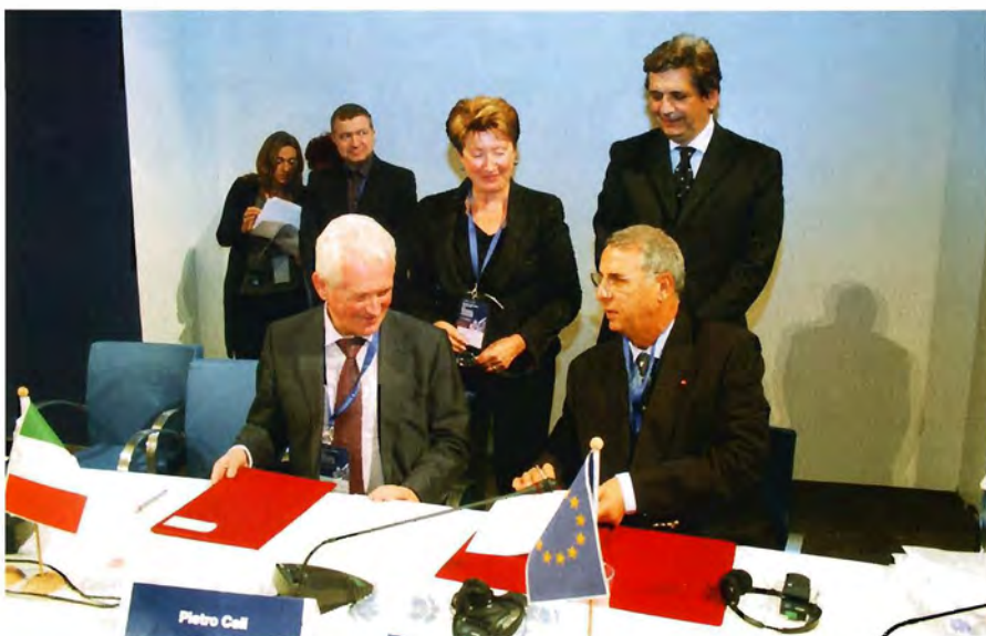
La firma del memorandum d'intesa tra il Governo della regione di Ulyanovsk e la Lega marittima italiana

Подписание меморандума о намерениях между правительством Ульяновской области и Итальянской морской лигой