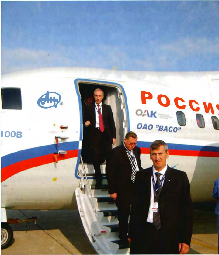
Ulyansk è definita la capitale del settore aeronautico russo

Ульяновск называют авиационной столицей России